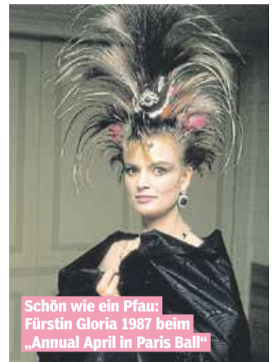
Schön wie ein Pfau: Fürstin Gloria 1987 beim „Annual April in Paris Ball“

VON THURN UND TAXIS: Das mache ich gerne, lieber Gerhard. Ich bringe dir ein Geburtstagsständchen. Versprochen.