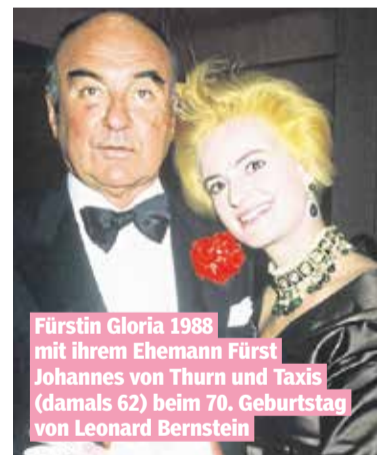
Fürstin Gloria 1988 mit ihrem Ehemann Fürst Johannes von Thurn und Taxis (damals 62) beim 70. Geburtstag von Leonard Bernstein